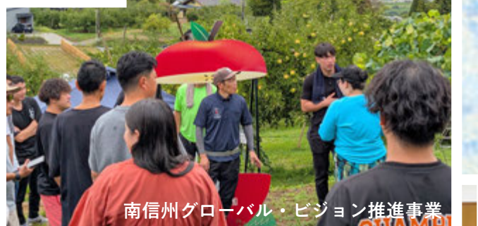
南信州グローバル・ビジョン推進事業