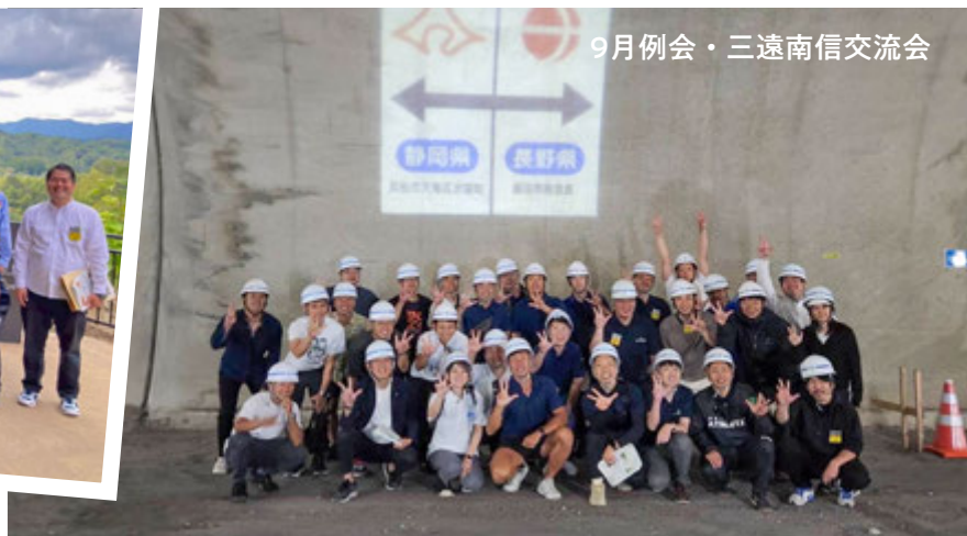
9月例会・三遠南信交流会