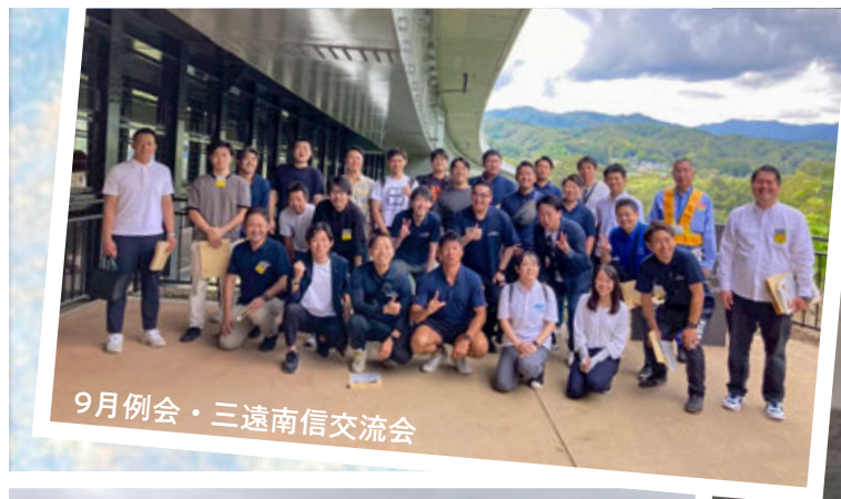
9月例会・三遠南信交流会